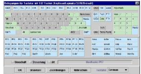
JProtector - Tastaturverwaltung

Darüber hinaus gibt es Szenarien, in denen der Einsatz einer eigenständigen Emulation nicht sinnvoll ist. Hierzu gehören z. B. die bereits erwähnten Portale. JProtector ermöglicht daher zwei weitere Formen der Nutzung. Zum einen kann die Emulation über den JavaBeans Mechanismus als graphisches Element in selbst entwickelte Applikationen integriert werden. Zum anderen kann die Emulation im Batch betrieben und die komplette Steuerung über Programme realisiert werden. In diesem Fall erfolgt keine Erzeugung einer darstellbaren graphischen JProtector Komponente.